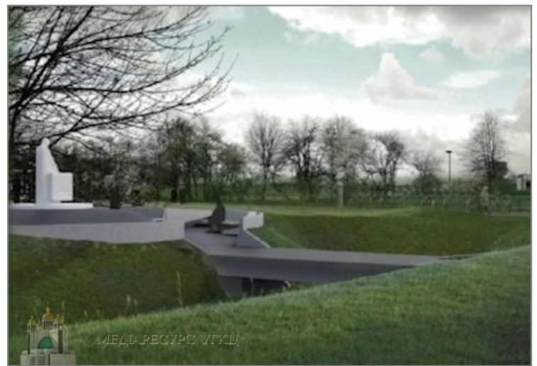
Artist rendering of final location for the monument.